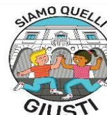
SCUOLA PRIMARIA "GIUSTI"