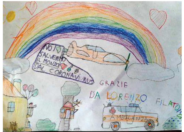
Lorenzo dedica il suo disegno ai medici perché è sicuro che troveranno presto una cura al coronavirus