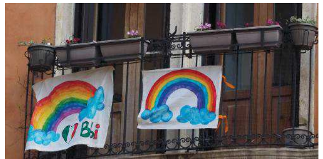
I primi arcobaleni sui davanzali della città "catturati" dal nostro fotografo.