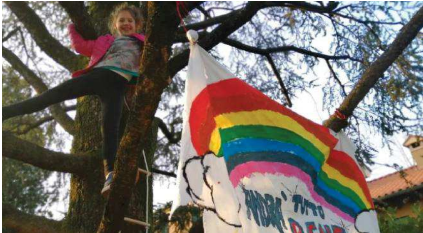
Un grande arcobaleno sta sventolando in via Zanella a Monticello Conte Otto: il giorno degli arcobaleni sarà domani in tutta la provincia

L'INIZIATIVA DEL GDV. Prende forma il progetto rivolto ai più piccoli, per capire come vivono questo tempo strano lontano da scuola e amici con giorni da inventare