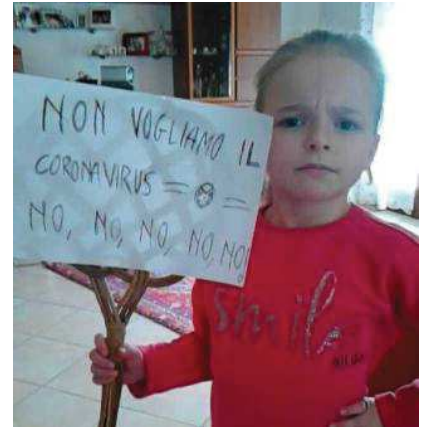
La battaglia Amy sciopera contro il coronavirus