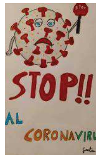
Greta ferma il virus con il divieto